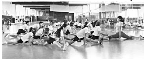
Alunos da Escola Estadual Léa Rosa praticam esporte em academia