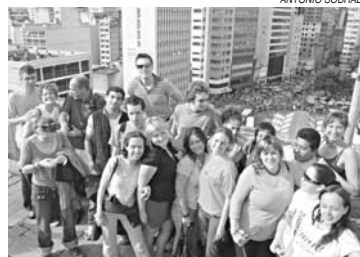
Grupo está participando de intercâmbio cultural