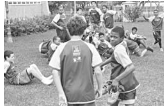
Show de Bola mobiliza e dá oportunidade a jovens

Outra iniciativa de sucesso é o Projeto Social Marista Show de Bola, que atende 600 crianças em situação