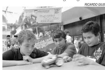
Projeto Semeiar é realizado na rede pública de Canoas