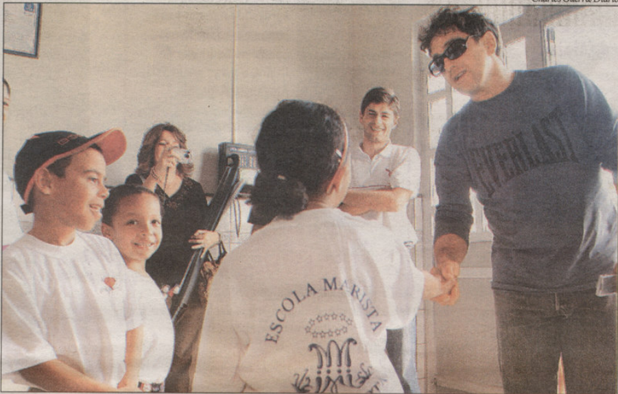
O artista foi recebido com entusiasmo pelos alunos e tentou retribuir o carinho com cumprimentos

O ator Marcos Frota não tem nenhuma deficiência física ou mental, mas alguns de seus personagens já tiveram. Estas experiências, que influenciaram o ator a lutar pela socialização de portadores de necessidades especiais, foi o que o trouxeram a Santa Maria ontem para participar do projeto Ação Marista de Responsabilidade Social.