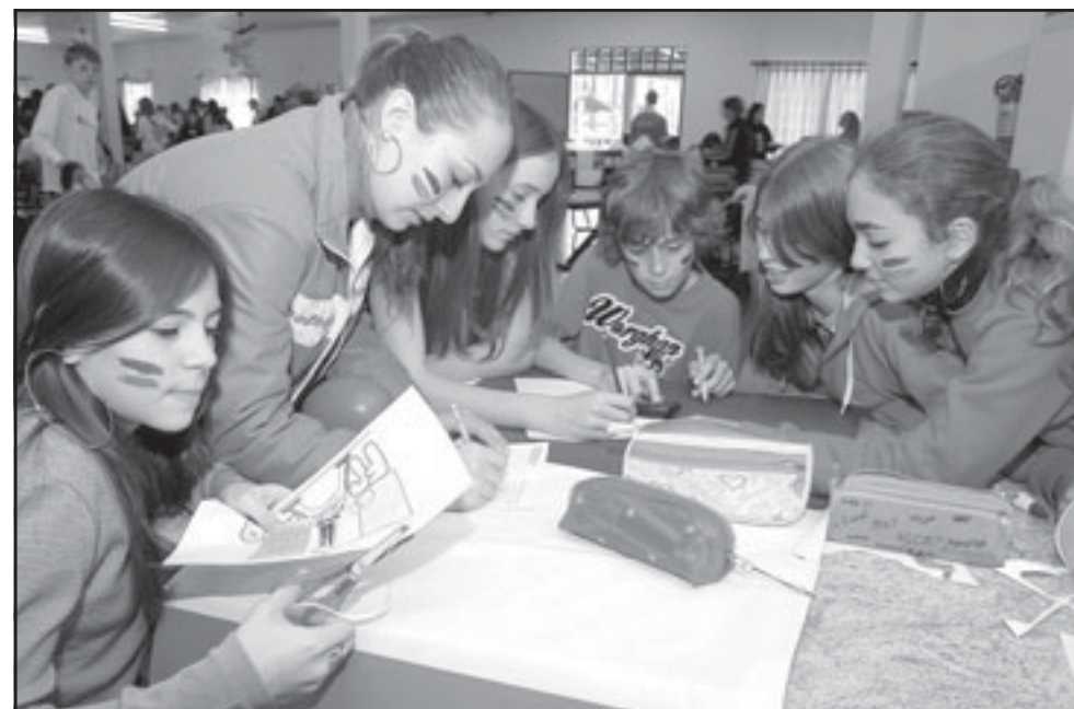
Equipe que representou a França aprovou a integração, que auxiliará no aprendizado