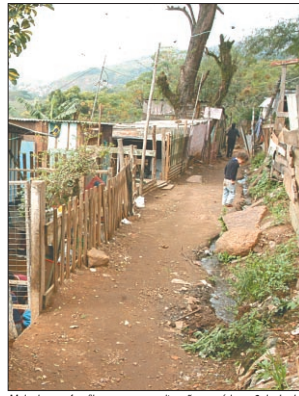
Mais de cem famílias moram em situação precária na 9 de Junho