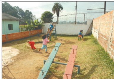
Creche Nossa Senhora de Fátima abriga também projetos ligados ao Sase