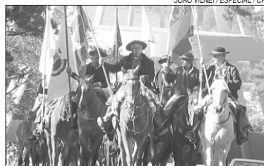
Atividade integra comemoração do aniversário da cidade

Antão, Arroio Grande, Santa Flora, Arroio do Sô, Passo do Verde, Pains, São Valentim e Palma, é parte da programação do 148º aniversário de Santa Maria, comemorado hoje. A cavalcada tem como tema Resgate Históricos dos Distritos, homenageando os que marcam a história da comunidade, como professores, trabalhadores rurais e subprefeitos. Participam 60 cavaleiros. O término será sábado, no Santuário da Medianeira.