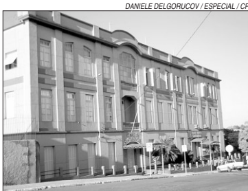
Colégio Marista encerrou suas atividades em 2005

O prefeito Wainer Machado quer transformar o local num pólo educacional modelo, com infra-estrutura para realização de cursos profissionalizantes e funcionamento de cursos de graduação da Unipampa e outras universidades públicas.