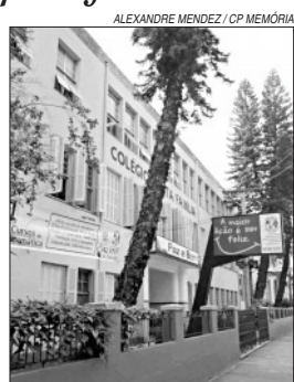
Uma história que se iniciou em 1907